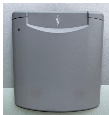
Aansluitpunt 220V buitenzijde