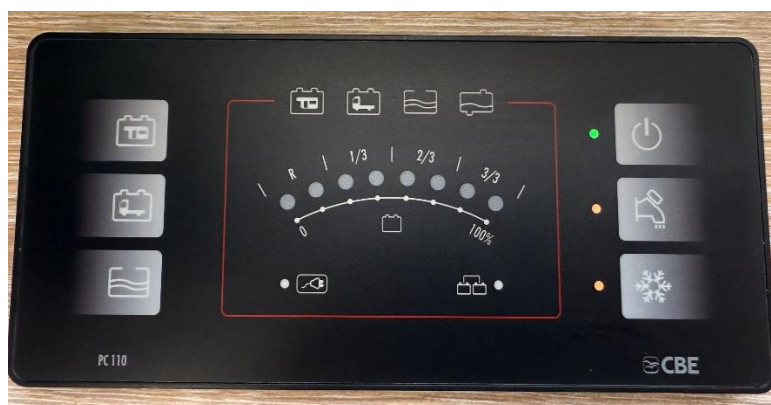
Paneel boven de schuifdeur